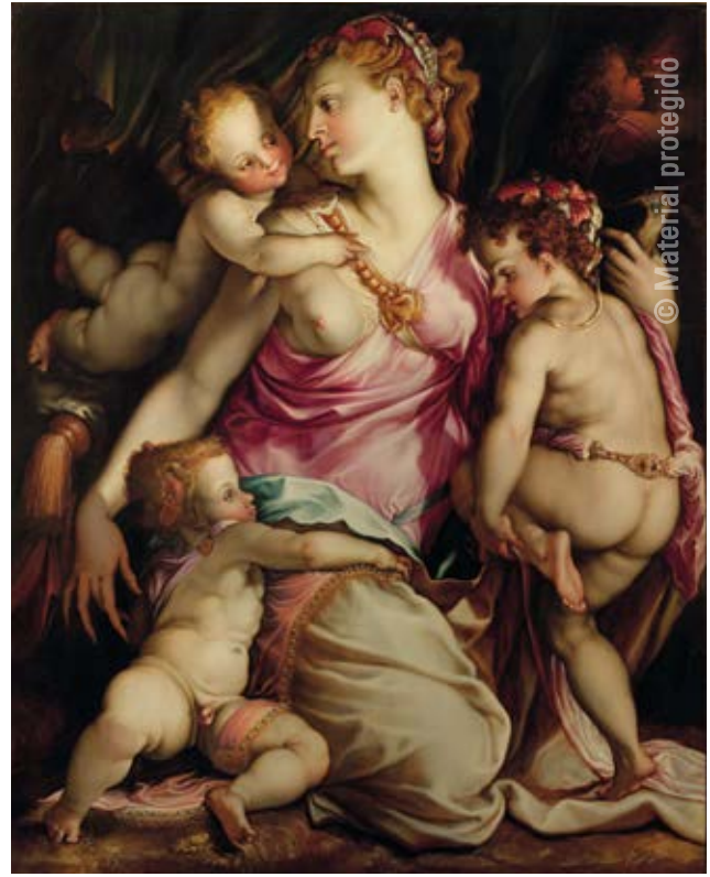
8. Francesco Salviati (1510-1563) Caridad Óleo sobre tabla. 156 x 122 cm Galleria degli Uffizi, Florencia N.º inv. 1890, 2157

y luego siguiendo el ejemplo de su maestro y viajando a Italia, donde vivió aproximadamente durante cinco años de la década de 1540 25 . Allí, Floris se interesó vivamente por las obras de la Antigüedad clásica y por Miguel Ángel, Rafael y los seguidores de éste. Regresó a Amberes, donde abrió una bottega siguiendo el modelo del taller de Rafael, y al parecer en un momento dado llegó a tener ciento veinte aprendices, toda una generación de artistas de los Países Bajos, que hicieron que su estilo y sus innovaciones alcanzaran nuevas cotas 26 .