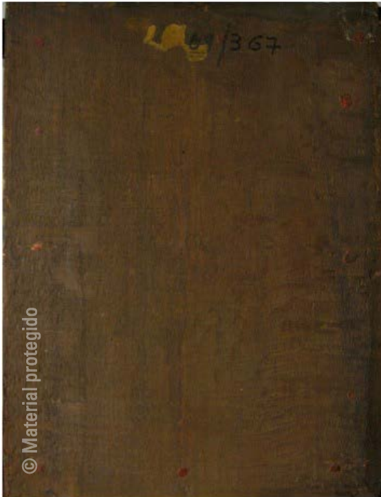
2. Anónimo flamenco Busto de mujer con velo , c. 1550-1570 Museo de Bellas Artes de Bilbao Reverso