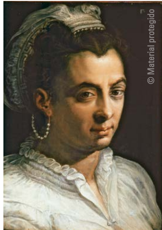
11. Frans Floris (1519/1520-1570) Cabeza de mujer , c. 1560 Óleo sobre tabla. 46,5 x 32,5 cm Museum de Fundatie, Heino / Wijhe en Zwolle, Países Bajos

expresivas al óleo 32 . Pero además, aunque no está claro que estos trabajos salieran del taller, las cabezas expresivas de Salviati, ricas fuentes de lo que John Shearman denominó «fantasías elaboradas» 33 , fueron ampliamente copiadas y difundidas 34 .