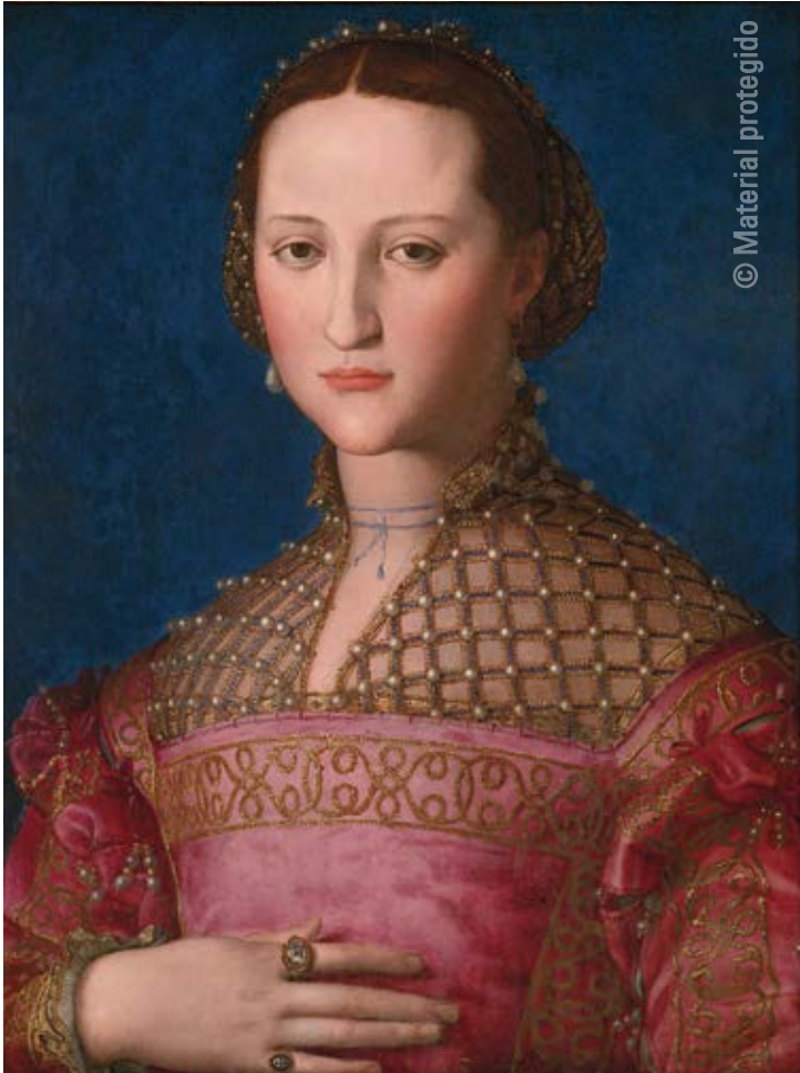
12. Agnolo Bronzino (1503-1572) Retrato de Leonor de Toledo , 1543 Óleo sobre tabla. 46 x 59 cm Národní Galerie, Praga

La legislación suntuaria en Florencia se revisó en reiteradas ocasiones durante el siglo XVI en un intento por evitar que las mujeres se vistieran de una manera considerada impropia de su condición social. En una carta de 1562, Cosme de Médicis defendió las leyes suntuarias que había aprobado. Su descripción de cómo una mujer decente ha de vestirse se corresponde con bastante exactitud con lo que vemos en el Busto de mujer con velo : «En primer lugar deseamos no prohibir las perlas por completo, es decir que sólo se podrá llevar un collar de una vuelta, por un valor máximo de 500 escudos. Esto lo hacemos porque todas las damas tienen perlas. No deseamos ponerlas a prueba; podrán llevar collares de oro y plata sin esmalte, como dispone la ley, pues esto supone mantener el capital» 46 .