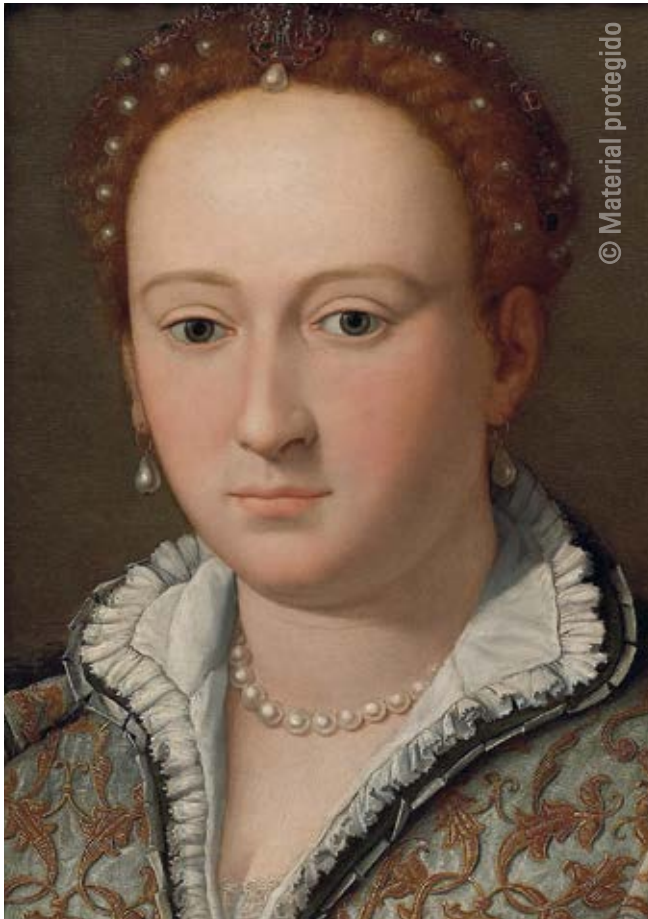
14. Alessandro Allori (1535-1607) Retrato de Bianca Capello , c. 1578 Óleo sobre cobre. 37 x 27 cm Galleria degli Uffizi, Florencia N.º inv. 1890, 1514

el destino de una mujer italiana estaba en gran medida en manos de su padre, de su marido o de la Iglesia, y que su derecho a la propiedad, a la herencia y a actuar en el ámbito público estaba controlado de manera estricta, los varones también estaban sometidos a limitaciones sociales. Los retratos de los miembros de uno y otro sexo suponen un complejo compromiso entre, por un lado, una persona que resulte reconocible y, por otro lado, una amalgama de «rasgos idealizados y atributos estilizados» con el fin de presentar «una identidad tal como la define la sociedad» 52 .