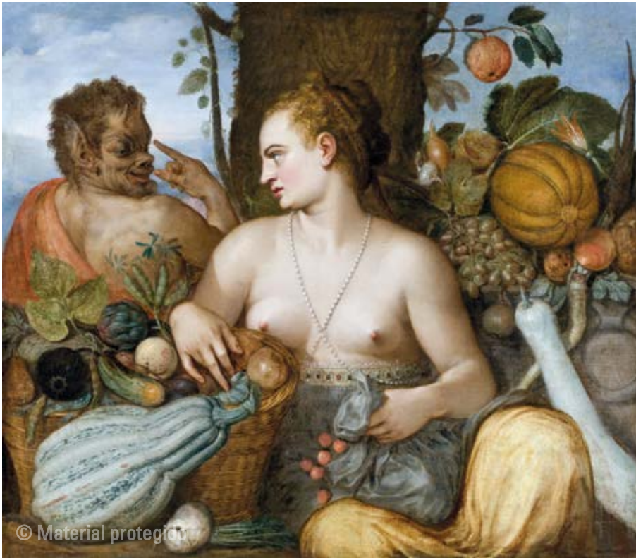
9. Frans Floris (1519/1520-1570) Aestas (Verano) , 1564-1565 Óleo sobre lienzo adherido a tabla 115,5 x 134 cm Hallwylska Museet, Estocolmo N.º inv. 3200 XXXII:B.157

divine de Miguel Ángel, cautivó a Floris 29 , que se puso a pintar docenas, cuando no centenares, de estudios de cabeza de tamaño natural, algunos de hombres coronados de laureles o tocados con sombreros y muchos de mujeres con elaborados peinados adornados con perlas y joyas.