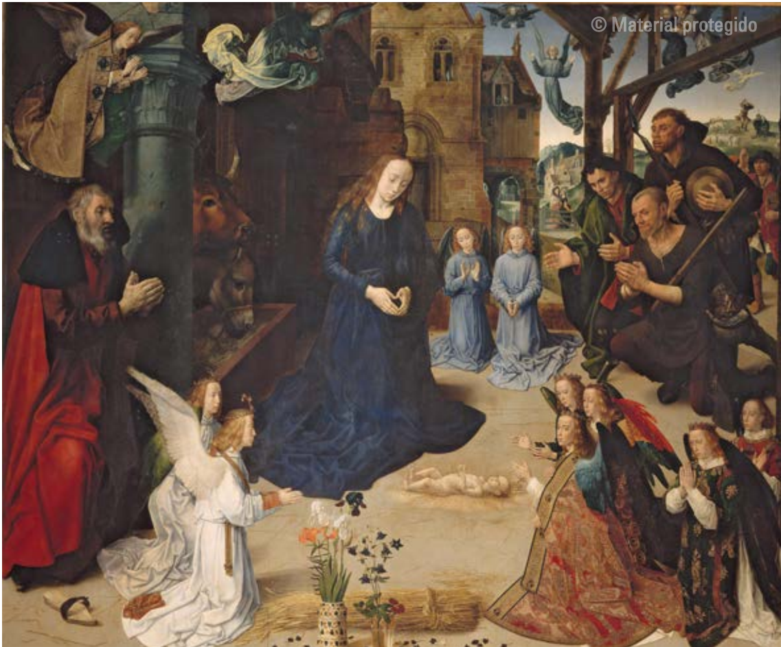
4. Hugo van der Goes (1440-1482/1483) La Adoración de los pastores Panel central del Triptico Portinari , 1476-1479 Óleo sobre tabla. 253 x 304 cm Galleria degli Uffizi, Florencia N.º inv. 1890, 3192