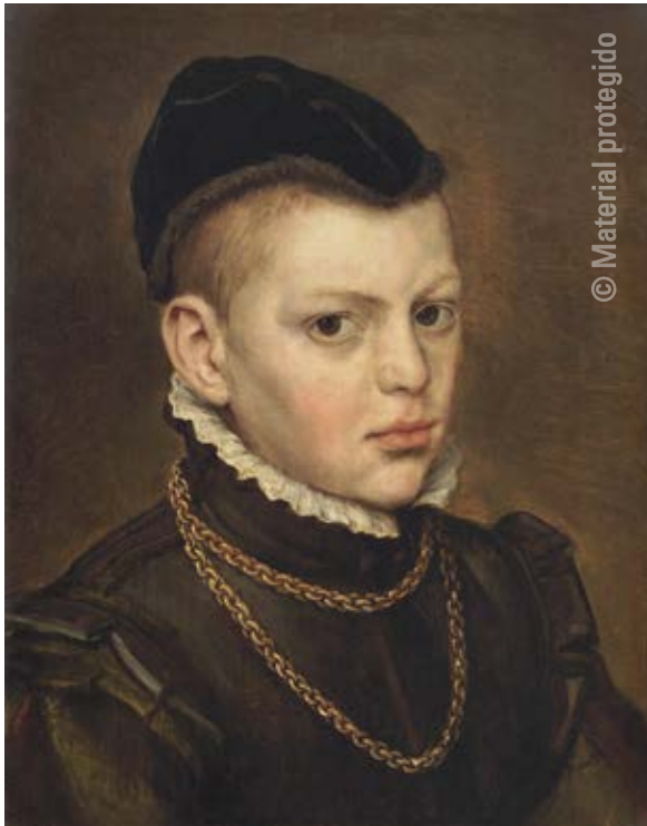
10. Frans Floris (1519/1520-1570) Retrato de muchacho , c. 1560-1565 Óleo sobre tabla. 35,7 x 27,2 cm Kunsthistorisches Museum, Viena, Gemäldegalerie N.º inv. GG_3532