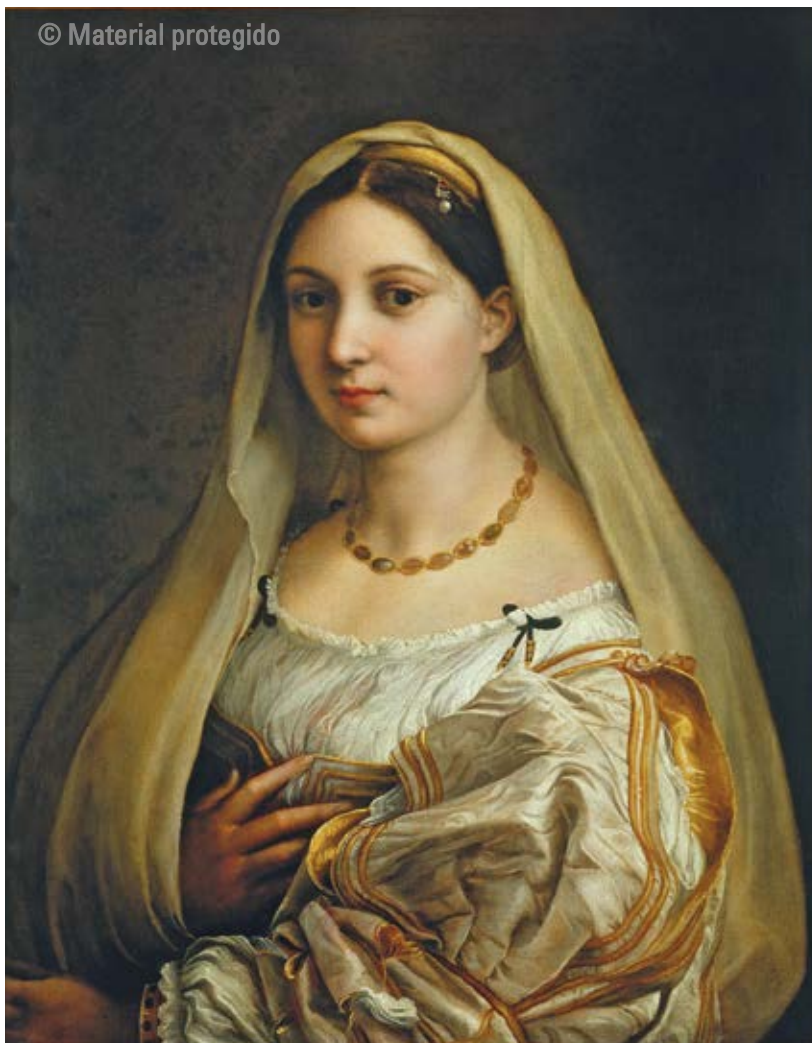
16. Rafael (Raffaello Sanzio) (1483-1520) La Donna Velata , 1514-1515 Óleo sobre lienzo. 82 x 60,5 cm Galleria Palatina, Palazzo Pitti, Florencia N.º inv. 245

I, que por aquel entonces estaba casado con Juana de Austria. Tras la muerte de ésta, Francisco y Bianca contrajeron matrimonio desoyendo las objeciones del cardenal Fernando, hermano mayor de Francisco 56 . Cuenta la leyenda que, al no darle Bianca heredero, temió por su destino si Francisco fallecía antes que ella. Los dos enamorados murieron misteriosamente el mismo día de 1587 en Poggio a Caiano. Corrieron rumores de un posible envenenamiento, y tan recientemente como en el año 2006 se realizó un estudio médico sobre los restos mortales de la pareja para comprobar la verdadera causa de su muerte 57 . En una tabla ahora en paradero desconocido [fig. 15] 58 que ha sido atribuida tanto a Bronzino como a Allori, Bianca Capello capta la mirada de quien contempla el retrato con unos ojos fascinantes que se parecen a los del Busto de mujer con velo . Si bien estas comparaciones no son suficientes para identificar a la modelo de este retrato como Bianca Capello, el parecido indica que la mujer representada en el cuadro de Bilbao, o el comitente de su