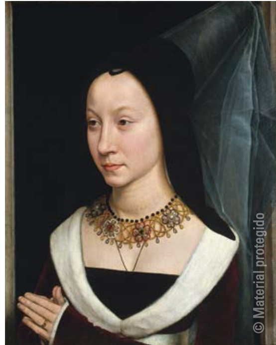
5. Hans Memling (c. 1435-1494) Tommaso di Folco Portinari (1428–1501) y Maria Portinari (Maria Maddalena Baroncelli) , c. 1470 Óleo sobre tabla. 44,1 x 33,7 cm (aprox., cada uno) The Metropolitan Museum of Art, Nueva York N.º inv. 14.40.626–27

Santa Maria Nuova, en Florencia, que ya había sido decorada al fresco por algunos de los artistas más destacados del Quattrocento : Domenico Veneziano, Piero della Francesca, Andrea del Castagno y Alessio Baldovinetti. El retablo sustituyó a una obra anterior de Lorenzo Monaco ejecutada al temple con amplias zonas de pan de oro. Para Portinari, Hugo van der Goes le ofrecía el incomparable atractivo del realismo, la riqueza del colorido y la atención naturalista a los detalles de los tejidos, el paisaje y el bodegón, todo ello posible gracias a la utilización de la pintura al óleo 13 .