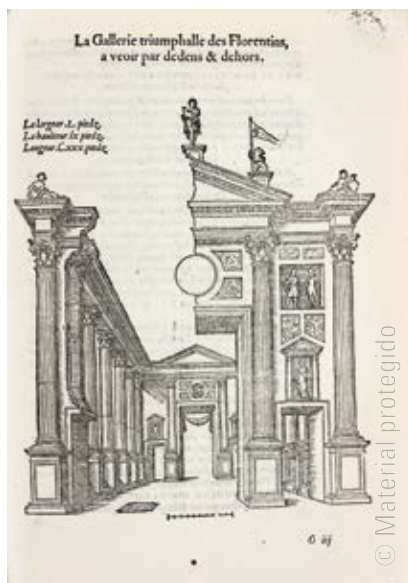
6. Anónimo Escenario de la nación de Florencia para la entrada de Felipe II en Amberes Xilografía. 22,4 x 15,8 cm En Cornelius Grapheus. Le triomphe d'Anvers, faict en la susception du Prince Philips, Prince d'Espaign[e] , p. 57 Amberes, Pieter Coecke van Aelst, 1550 British Library, Londres C 75 d 15

uno de los arcos ceremoniales monumentales que adornaron la entrada triunfal en la ciudad de Carlos V y Felipe II [fig. 6]. El escenario, de casi dos metros de alto, fue diseñado para impresionar al emperador y al futuro rey —así como a los habitantes de Amberes— con la preponderancia florentina en los campos de la literatura y de las artes visuales. Además de imágenes de los santos patronos y de los gobernantes de Florencia en aquel momento, la estructura incluía retratos de los poetas Dante, Petrarca y Boccaccio, así como de los dos artistas que abrían y cerraban respectivamente el contenido del texto de Vasari: Giotto, proverbial fundador de la escuela toscana, y Miguel Ángel, el artista «divino» que para entonces ya había terminado el Juicio Final en la Capilla Sixtina 22 .