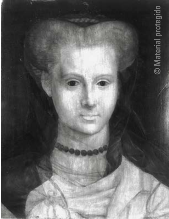
13. Anónimo flamenco Busto de mujer con velo , c. 1550-1570 Museo de Bellas Artes de Bilbao Reflectografía infrarroja

Sin embargo, la manera de llevarla, abierta y sujeta con un nudo a otra prenda marrón que oculta una camisola verde, no tiene precedentes en los retratos que he examinado. Además, el púdico velo que cubre la cabeza y los hombros y envuelve el cuello es una hermosa muestra de maestría pictórica, pero también un complemento muy inusual, y no está claro si las cintas de cuero que le caen a ambos lados de los hombros tienen utilidad. Se diría que su atuendo es el de una cazadora, lo que posiblemente sugiera que se trata de un portrait historié , el retrato de un personaje conocido representado a través de un tipo histórico específico. Esta tradición del retrato «alegórico» estaba muy arraigada en el Renacimiento y los artistas florentinos, incluido Bronzino, pintaron figuras ataviadas «como» personajes mitológicos o históricos. Sin embargo no se han encontrado prototipos para el Busto de mujer con velo y la ausencia de un cuarto creciente de luna, un carcaj o unas flechas excluye, al parecer, la identificación con Diana, la cazadora más frecuentemente representada 49 .