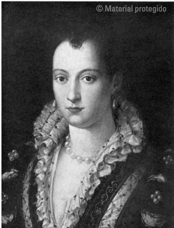
15. Anónimo florentino Retrato de Bianca Capello, duquesa de Médicis Paradero desconocido

parezca mayor y más madura; también le confieren el aspecto de una mujer florentina idealizada, cuyo parecido con el natural fue modificado para adaptarse a los retratos más fastuosos de los miembros de la corte de los Médicis, como el retrato antes mencionado que hizo Bronzino de Leonor de Toledo [fig. 12], en el que el artista modula los rasgos y juega con los valores tonales de manera que el rostro de la modelo se ve inusualmente pálido, casi ebúrneo, manifestación exterior de su gracia interior 54 .