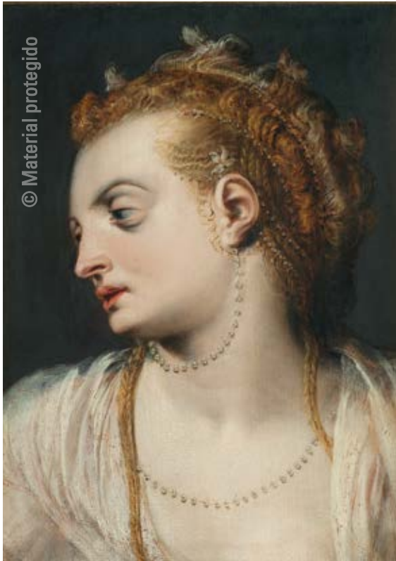
7. Frans Floris (1519/1520-1570) Cabeza de mujer Óleo sobre tabla. 46 x 33 cm Národní Galerie, Praga