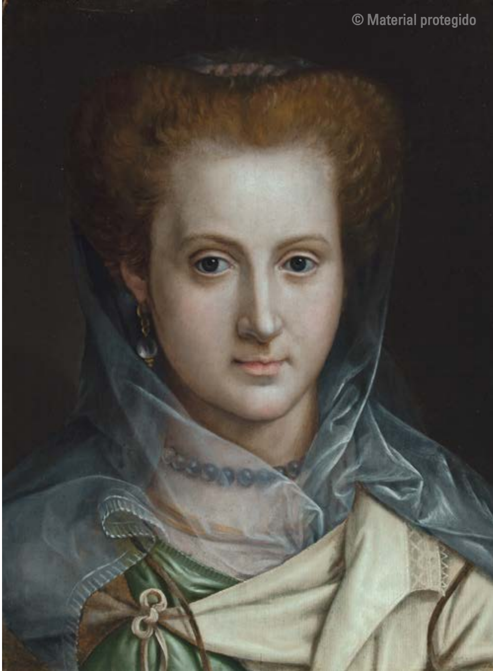
1. Anónimo flamenco Busto de mujer con velo , c. 1550-1570 Óleo sobre tabla de roble. 47 x 36 cm Museo de Bellas Artes de Bilbao N.º inv. 69/367