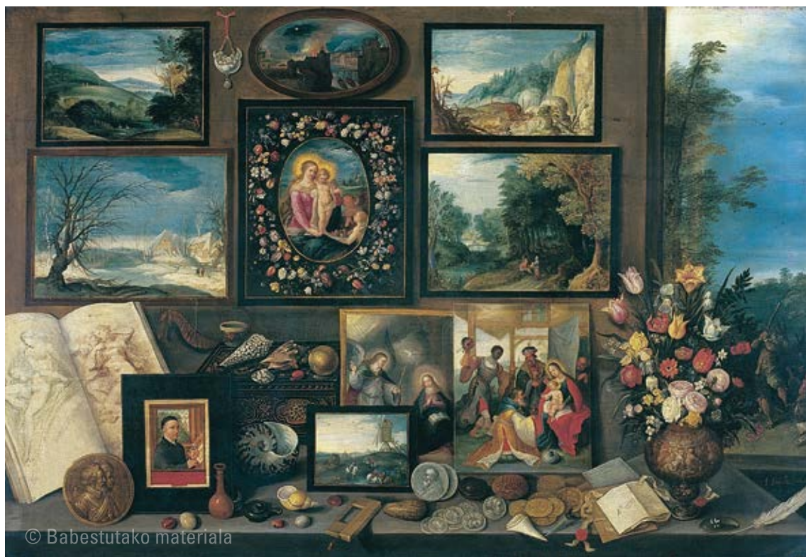
9. Frans Francken II (1581-1642) Bildumagilearen kabinetea , 1619 Olioa oholean. 56 x 85 cm Koninklijk Museum voor Schone Kunsten, Anberes Inb. zenb. 816

dago gaur egun Anberesko Arte Eder Museoko fondoetan gordeta; bertako leku nabari batean Andre Maria-ren, Umearen eta aingeruen margolan bat dago eta antz handia dauka 3. irudiko lankidetzapeko lanarekin [9. ir.] 15 . Proportzioak desberdinak izan arren –Anberesko margolaneko irudi nagusia handi samarra da–, girlandaren konposizioa ia berdina da. Bere kabineteko piezako girlanda egiteko, Franckenek lehendik zegoen margolan bat eredutzat hartu izan balu, Danielsek sinatutako girlanda 1618. urtearen inguruan edo lehenago egin bide zela esan genezake. Franckenek pinturan egindako ekarpenaren tratamendua eta estiloa bat datoz data bereko, hau da, 1618ko beste lan batekin. Beraz, hipotesia egiaztatzen da. Horrez gain, kabineteko margolanean lorez betetako loreontzi apaindua ere agertzen da, eta nolabaiteko antza du Bilboko natura hileko loreontziarekin. Lore-sorta, ostera, zeharo inspiratuta dago Jan Brueghel Zaharrak 1609. urtearen inguruan egindako konposizio batean [10. ir.] 16 .