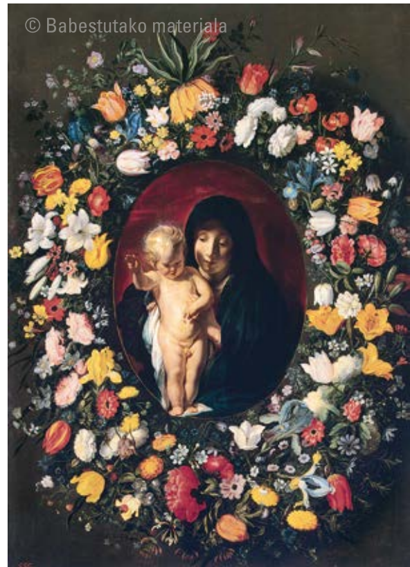
4. Andries Daniels jarraitzailea (1599 eta 1640. urteen artean edo geroago); Jacob Jordaens (1593-1678) Andre Maria eta Umea, lorez egindako girlanda batean, c. 1618 Olioa oholean. 104 x 73,5 cm The State Hermitage Museum, San Petersburgo Inb. zenb. GE-2041