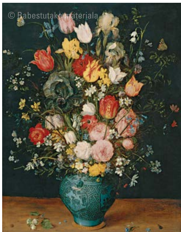
10. Jan Brueghel Zaharra (1568-1625) Lore-sorta, loreontzi urdin batean , c. 1609 Olioa oholean. 66 x 50,5 cm Kunsthistorisches Museum, Gemäldegalerie, Viena Inb. zenb. GG 558