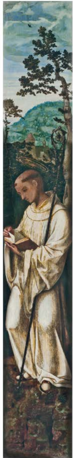
1. Jan van Dornickeren (jardunean 1505-1527) tailerra Zigorkatzearen triptikoa, San Benito eta San Bernardorekin, 1520-1530 Olioa haritz-oholean. 86 x 33 cm (erdiko ohola); 86 x 14,2 cm (alboko oholak); Bilboko Arte Ederren Museoa Inb. zenb.: 69/329