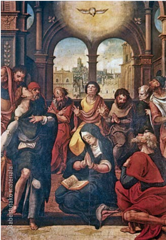
7. Pieter Coeck van Aelst (1502-1550), tailerra Mendekoste , c. 1530-1540 Olioa oholean. 83,8 x 62,2 cm Iziko Museum of South Africa. Art Collections, Lurmutur Hiria, Hegoafrika

etako Afari Santuetan landutako Jesusen irudiek bezala 33 . Munichekoarekin beste antzekotasun bat ere badu, gainera: zoruko zoladura, kolore arrosa, okre eta urdinak txandakatzen dituen hiruki eta laukien diseinu batean, bilduma pribatu bateko Artzainen adorazioa triptikoaren atzealdeko Deikunde an ikusten denaren antzera 34 .