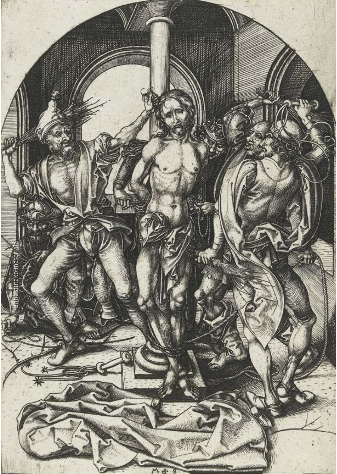
4. Martin Schongauer (1435/1450-1491) Zigorkatzea , c. 1480 Grabatua beranaz paperean. 16,3 x 11,6 cm Ashmolean Museum, University of Oxford Inb. zenb.: WA1863.2146