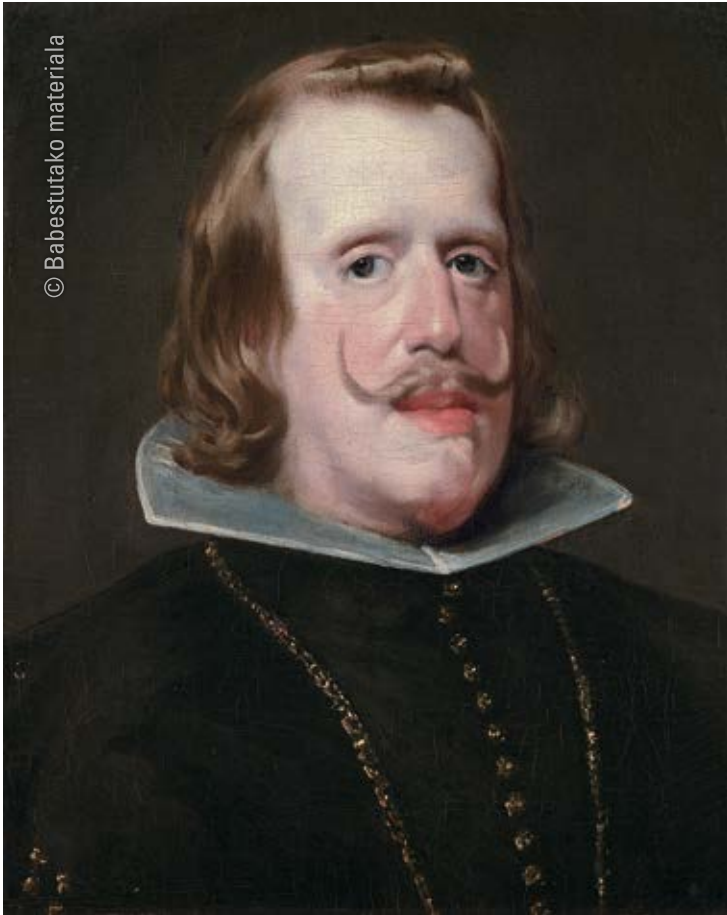
9. Diego Velázquez (1599-1660) tailerra Felipe IV.a , 1654 Olioa mihisean. 47 x 37,5 cm Kunsthistorisches Museum, Viena, Gemäldegalerie Inb. zenb.: GG 324

tailerrarekin, eta Felipe IV.aren erregealdiaren amaieran, 1660ra arte Velázquezek zuzendu zuen tailer hori, eta ordutik 1665era Martínez del Mazok. 1623an Velázquez Madrilera iritsi zenenean, erregearen irudia zorrotz kontrolatzeari ekin zioten 21 . Mailaz mailako prozesua izan zen, gorabehera batzuk izan baitzituen, eta Felipe IV.aren azken erretratuen saila atera zenean iritsi zen gorenera.