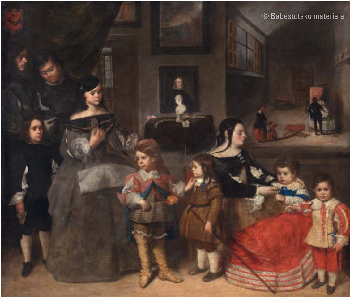
12. Juan Bautista Martínez del Mazo (c. 1611-1667)