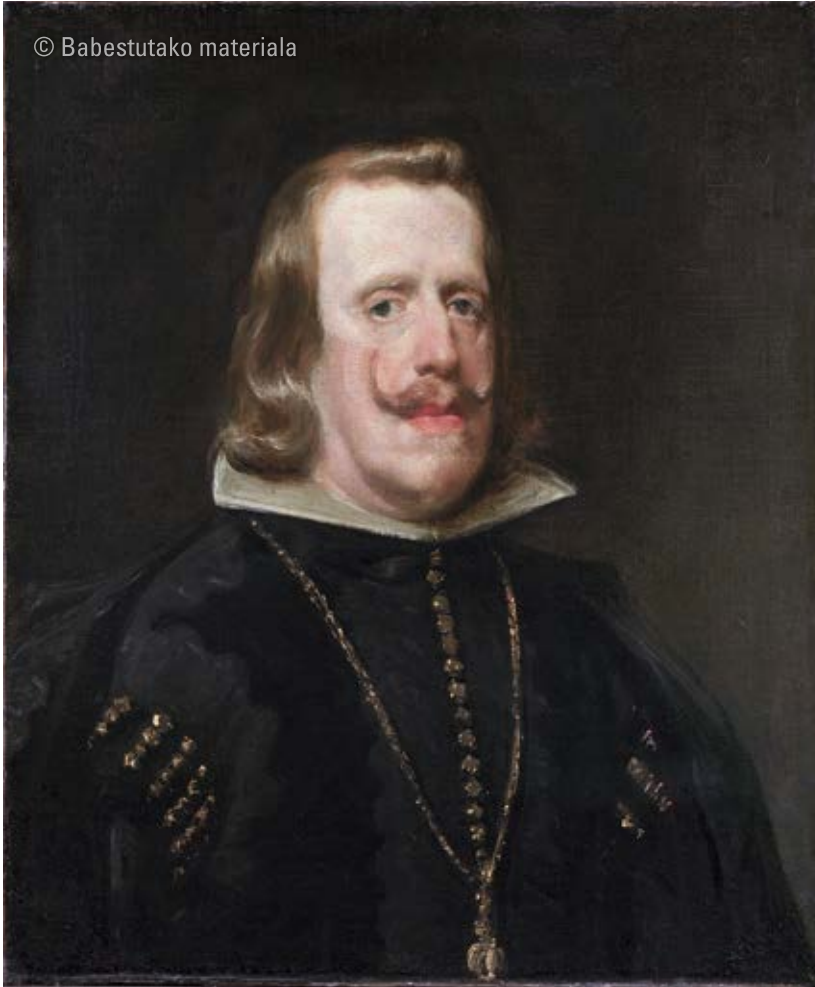
7. Diego Velázquez (1599-1660) egotzitakoa Felipe IV.a , c. 1656 Olioa mihisean. 64,1 x 53,7 cm The National Gallery, Londres Inb. zenb.: NG745

Dena dela, bitxia bada ere, gehien zabaldu zen Felipe IV.aren erretratu-eredua ez zen Pradoko margolan bikaina izan, lehen aipatu dugun beste bertsio bat baizik. Londresko National Galleryn dago gorderik kalitate handiena duen bertsio horretako alea. Lehen esan bezala, 1657ko Villafrancako estanparen abiaburua da, bere kronologia zehazteko ante quem terminoa ezartzen duena. Ardi-larrua urrezko kate batetik dago zintzilikatuta –botoietan eta brodatuetan erabiltzen zuten metal beretik–; eta horrek ere data hori berresten du. 1657ko irailaren 11ko pragmatika batek debekua ezarri zuen jantzietan metal hori erabiltzeko, eta, beraz, denbora-muga zehaztu zuen erretratuari begira 16 . Azkenean, bertsio hori izango da «irudi ofiziala» Felipe IV.aren erregealdiko azken urteetan. Hala, Villafrancak bertsio horixe hartu zuen abiaburutzat liburuetako azal eta atariko orrietan jartzeko (batzuk monarkiari lotuta baitaude), eta, hortaz, hainbat urtetako argitalpenetan agertzen da: 1660, 1662 (bitan), 1664, 1666 eta 1667an. Erretratua antzekoa izaten da beti; inguruan duen gune erretorikoa baizik ez da aldatzen.