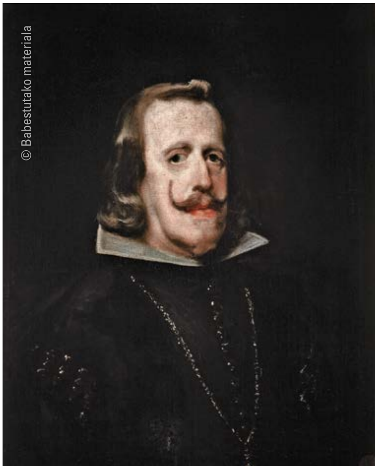
11. Diego Velázquez (1599-1660) tailerra Felipe IV.aren erretratu , c. 1656 Olioa mihisean. 66 x 40 cm San Fernandoko Arte Ederren Erret Akademia, Madril