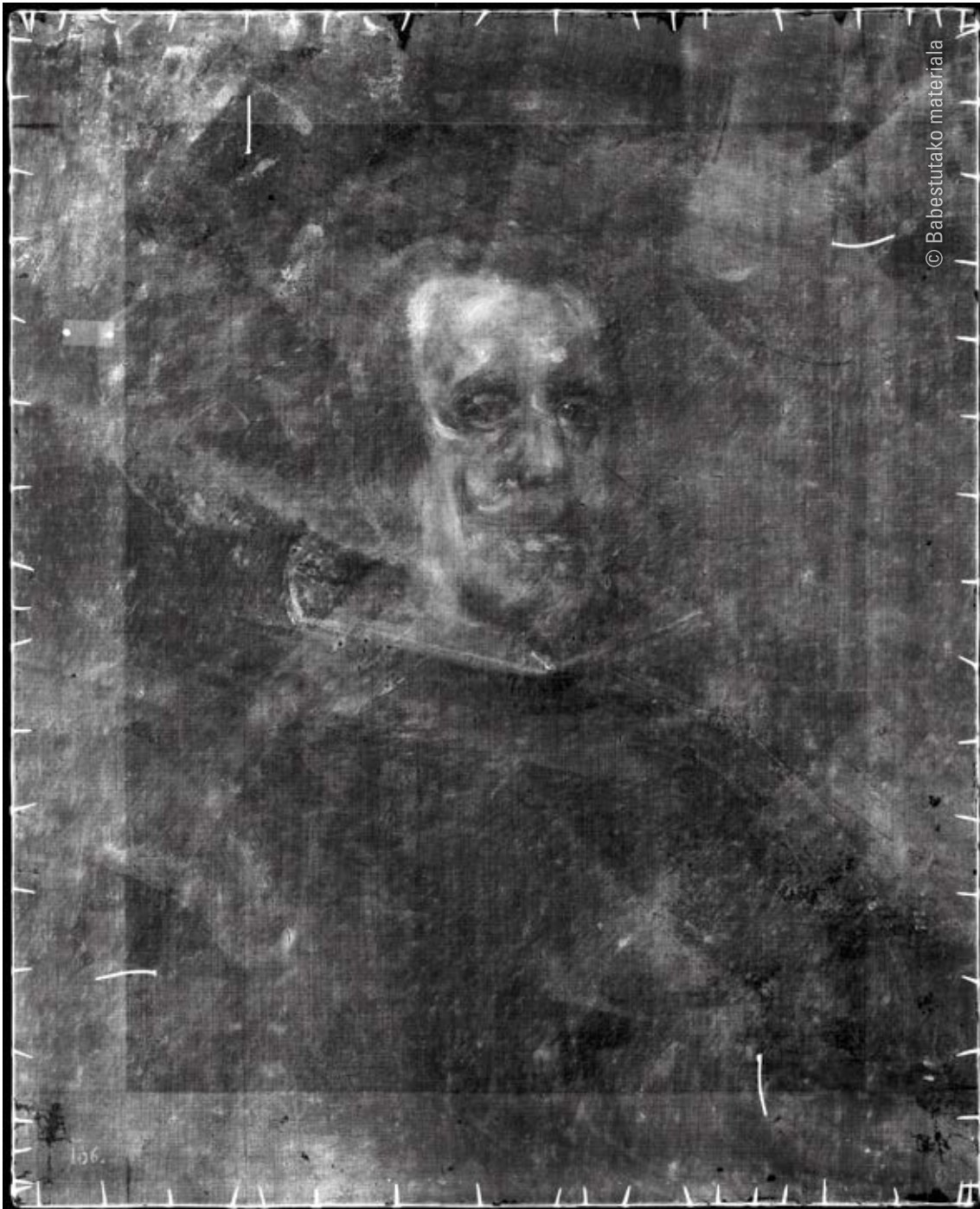
8. Diego Velázquez (1599-1660) Felipe IVa , c. 1654 Pradoko Museo Nazionala, Madril Erradiografia