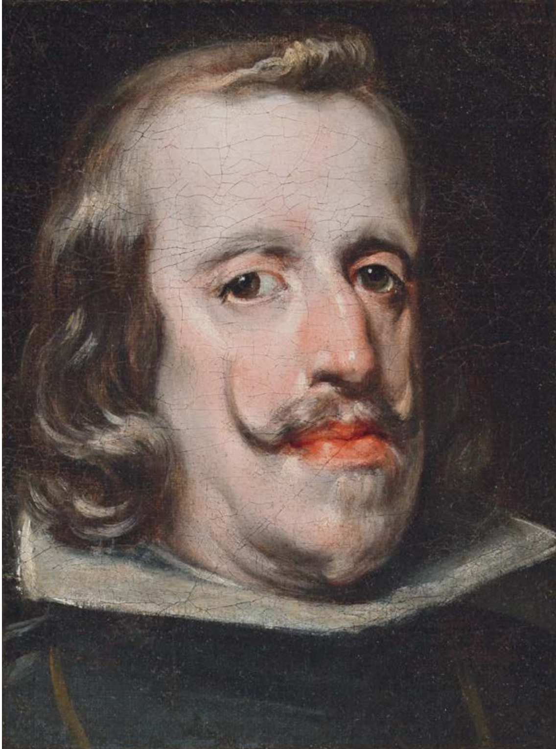
1. Diego Velázquez (1599-1660) zirkulua Felipe IV.aren erretratua (zati bat) , c. 1657 Olio mihisean. 40,5 x 32,5 cm Bilboko Arte Ederren Museoa Inb. zenb.: 69/237