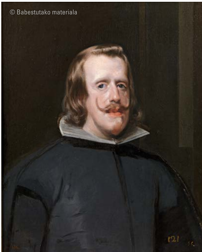
6. Diego Velázquez (1599-1660) Felipe IV.a , c. 1654 Olioa mihisean. 69,3 x 56,5 cm Pradoko Museo Nazionala, Madril Inb. zenb.: P1185

nonahi azaldu ohi zen Urrezko Ardi-larrua ere ez da ageri. Biluztasun erretoriko hori ikusita, nabaria da irudia ez zela modu «ofizialean» erabiltzen. Gainera, irudiaren egikera oso argia da, eta alde batzuk zirriborrotuta baizik ez daude. Hori guztia aintzat hartuta, pentsa dezakegu beharbada «prototipo» modura erabiliko zutela, hau da, erregea paratuta moldatuko zutela lana, gero erregearen irudiak (tailerraren bidez) ugaltzeko abiaburu gisa baliatzeko 12 . Ildo horretan, aipatzeko modukoa da artelana errege-bildumetan agertzen dela 1745ean lehenengo aipamen ziurra egin zenetik 13 .