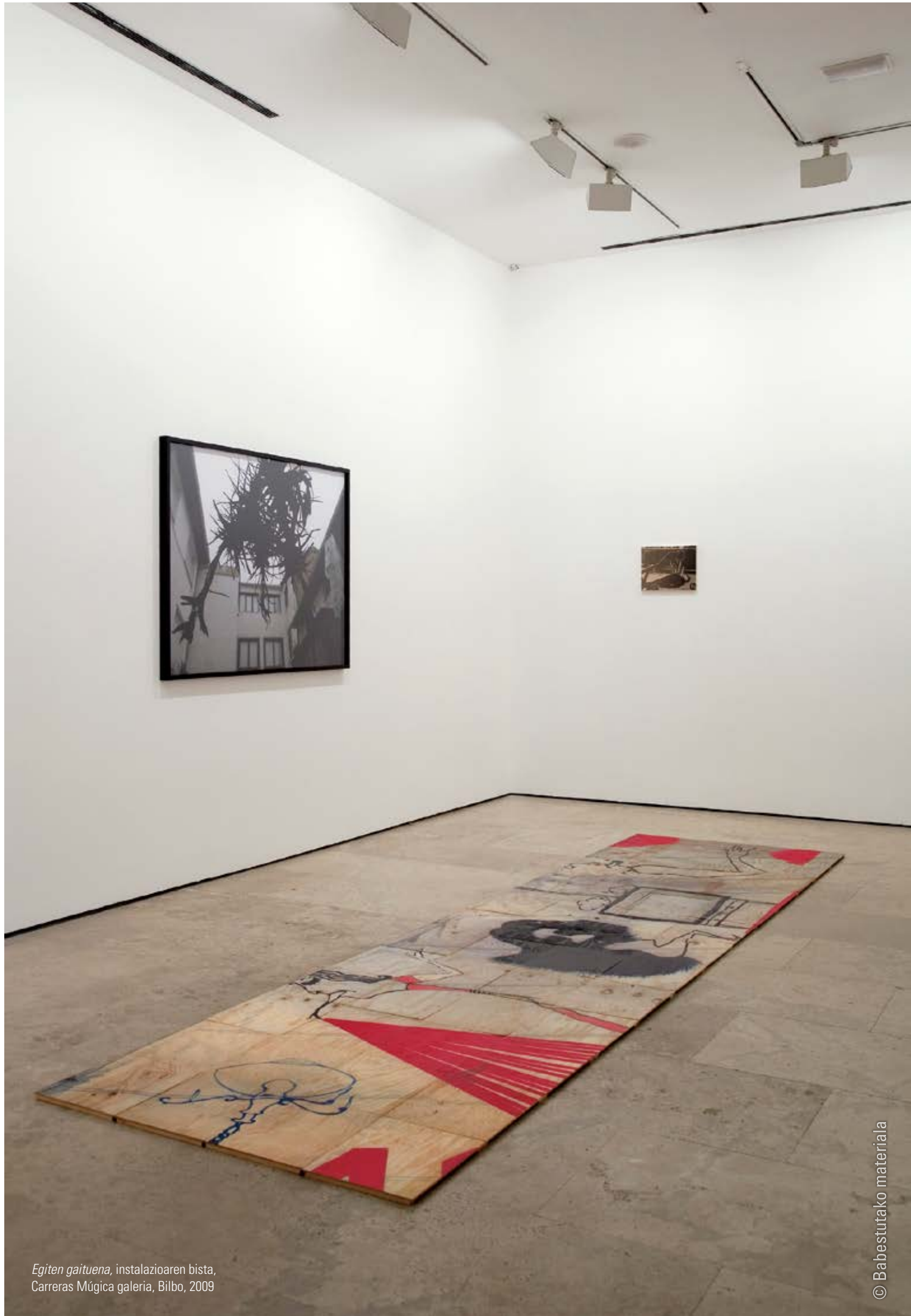
Egiten gaituena , instalazioaren bista, Carreras Múgica galeria, Bilbo, 2009