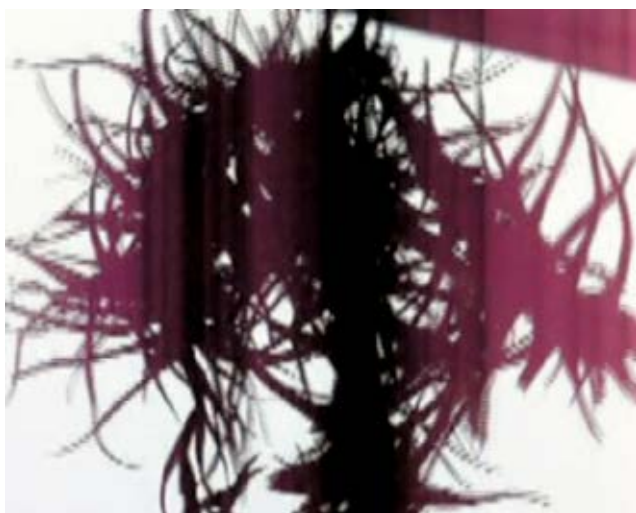
Domestic flights, 2010, bideo grabazioa