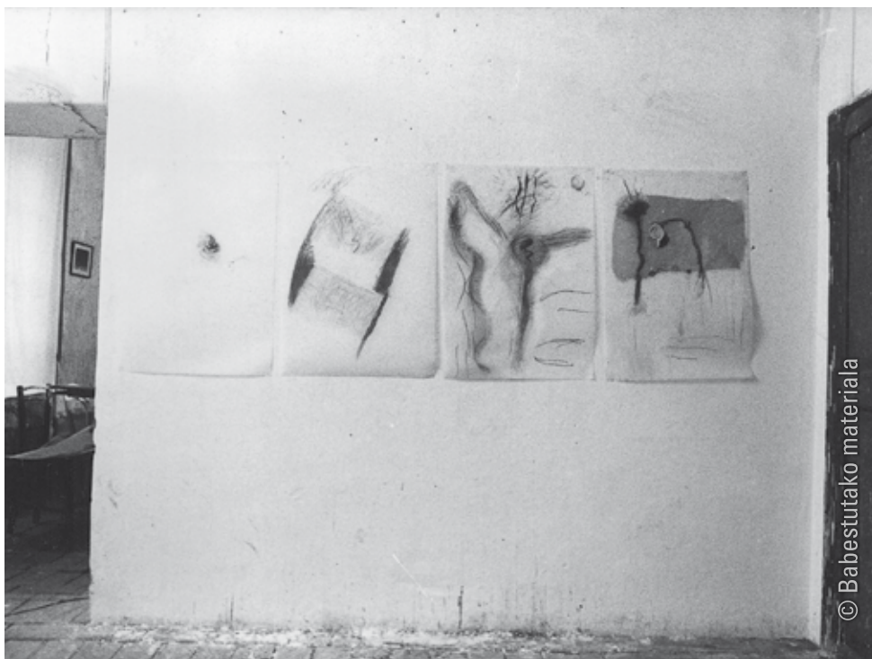
Disegni vegetali seriea, instalazioaren bista, estudioa Vicolo Santa Margherita, Erroma, 1987