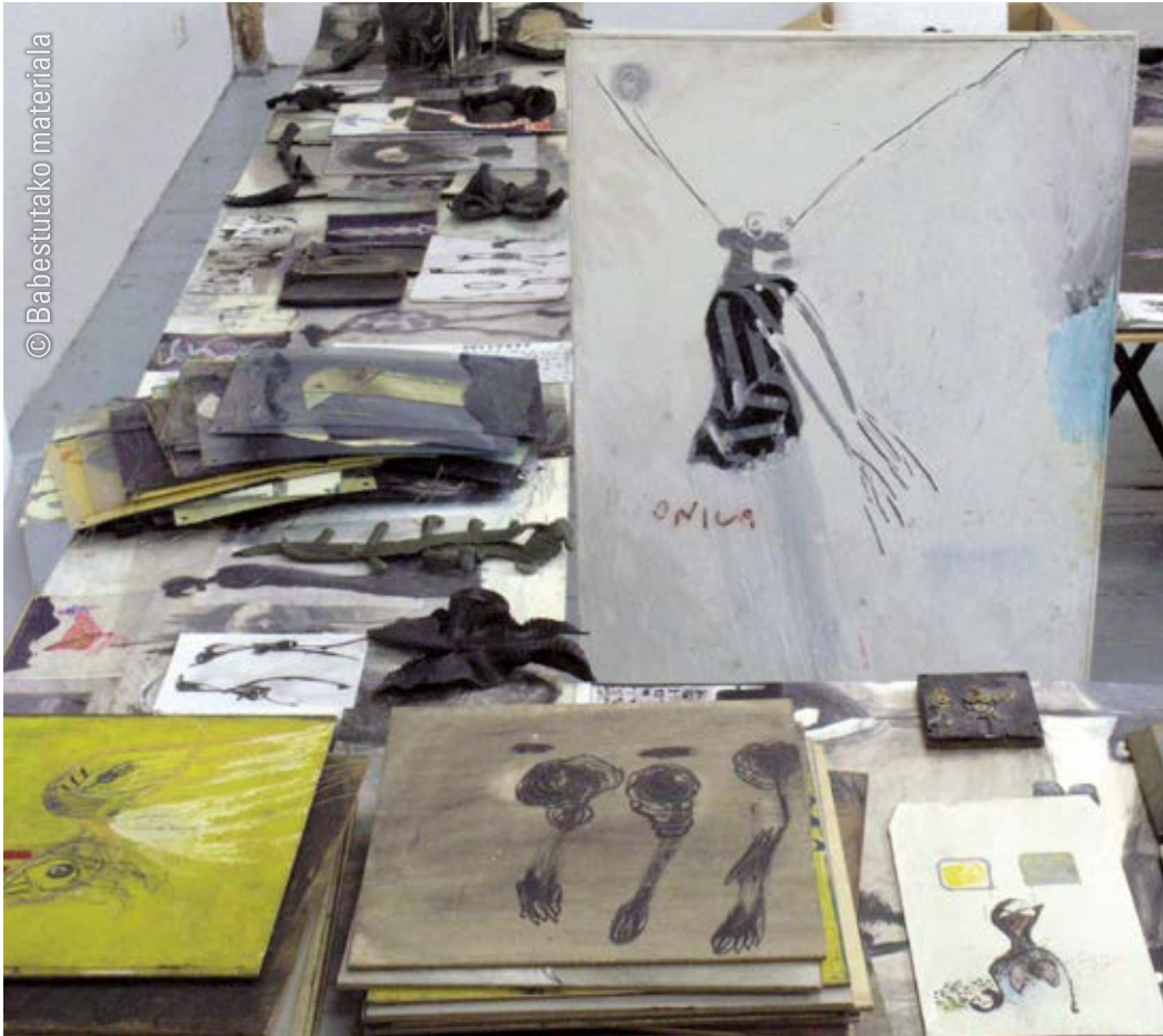
Kronica (1992), Erroma-mahaiaren barruan instalatuta, Bilboko estudioan, 2016