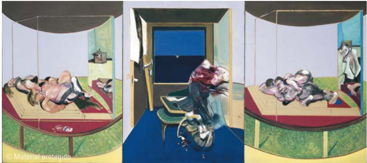
7. Francis Bacon (1909-1992) Tríptico – Inspirado en el poema «Sweeney Agonistes» de T.S. Eliot, 1967 Óleo sobre lienzo. 198 x 147,5 cm Hirshhorn Museum and Sculpture Garden, Smithsonian Institution, Washington, D. C. Donación de Joseph H. Hirshhorn Foundation, 1972

Aplicó pastel y óleo seco en movimientos a menudo circulares en la estructura descubierta del lienzo. Los realces blancos, por el contrario, están aplicados con pintura pastosa. Como también se observa en otros cuadros, sólo estaba predefinida la línea ligeramente arqueada que discurre horizontal, que sirve tanto a la división de la superficie como al posicionamiento de la figura que se recuesta en ella. El suave violeta de la mitad superior del cuadro y el amarillo de la inferior fueron aplicados luego superficialmente; así, por ejemplo, el delicado violeta en las zonas del borde se hace también visible bajo la figura. El amarillo y el violeta, pero también el negro intenso de los estores que cuelgan del borde superior de la pintura, debieron de ser aplicados con un rodillo. Posteriormente, Bacon trazó las líneas que se encuentran en un ángulo obtuso y enmarcó así la figura sobre la superficie del cuadro. Las conocidas estructuras en forma de jaula de las obras de los años cincuenta y sesenta, que dan apoyo a las figuras dentro del espacio del lienzo, son reemplazadas aquí por un simple marco. La superficie amarilla está cubierta de una capa de fina arena, que, sin embargo, no queda adherida en todas partes. Dentro del pretendido espejo, Bacon retoca con un paño sucio esta zona áspera y de aspecto brillante por el reflejo de luz, y con ello limpia parcialmente la arena. Sólo esta parte más oscura y compacta dentro del «marco» sugiere por sí sola el reflejo del espejo.