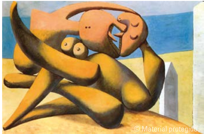
4. Pablo Picasso (1881-1973) Figures au bord de la mer (Figuras al borde del mar) , 1931 Óleo sobre lienzo. 130,5 x 195,5 cm Musée Picasso, París