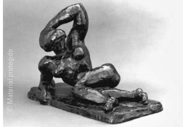
6. Henry Matisse (1869-1954) Nu couché I (Aurore) (Desnudo tumbado I (Aurora)) , 1907 Bronce. 36 x 51 x 27 cm Musée d'Art Moderne de la Ville de Paris

Mediante dos líneas que discurren paralelas se perfilan dos lados de este espejo, colocado oblicuamente en la habitación y cortado por los bordes izquierdo y superior de la obra. En el interior del cuadrado, que contiene muy oprimido el espacio de la figura acostada, sólo el amarillo es más intenso. Pero no se perciben ni la esperada distorsión del espacio ni la simetría entre habitación y reflejo. La supuesta claridad del cuadro cede, provocando una inseguridad permanente. El espejo no sirve aquí ni a una «distorsión o alteración de la figura representada» 5 ni a su duplicación. Aparece como mera afirmación, para la que no hay indicios suficientes. Gilles Deleuze llegó al fondo de la cuestión en 1984 en su interesante estudio sobre la obra de Bacon: «Todo es posible en el espejo de Bacon, excepto una superficie reflectante». En referencia a Lying Figure in Mirror prosigue: «el cuerpo penetra en el espejo, toma asiento, él mismo y su sombra. De ahí la fascinación: no hay nada detrás del espejo, sólo en él» 6 .