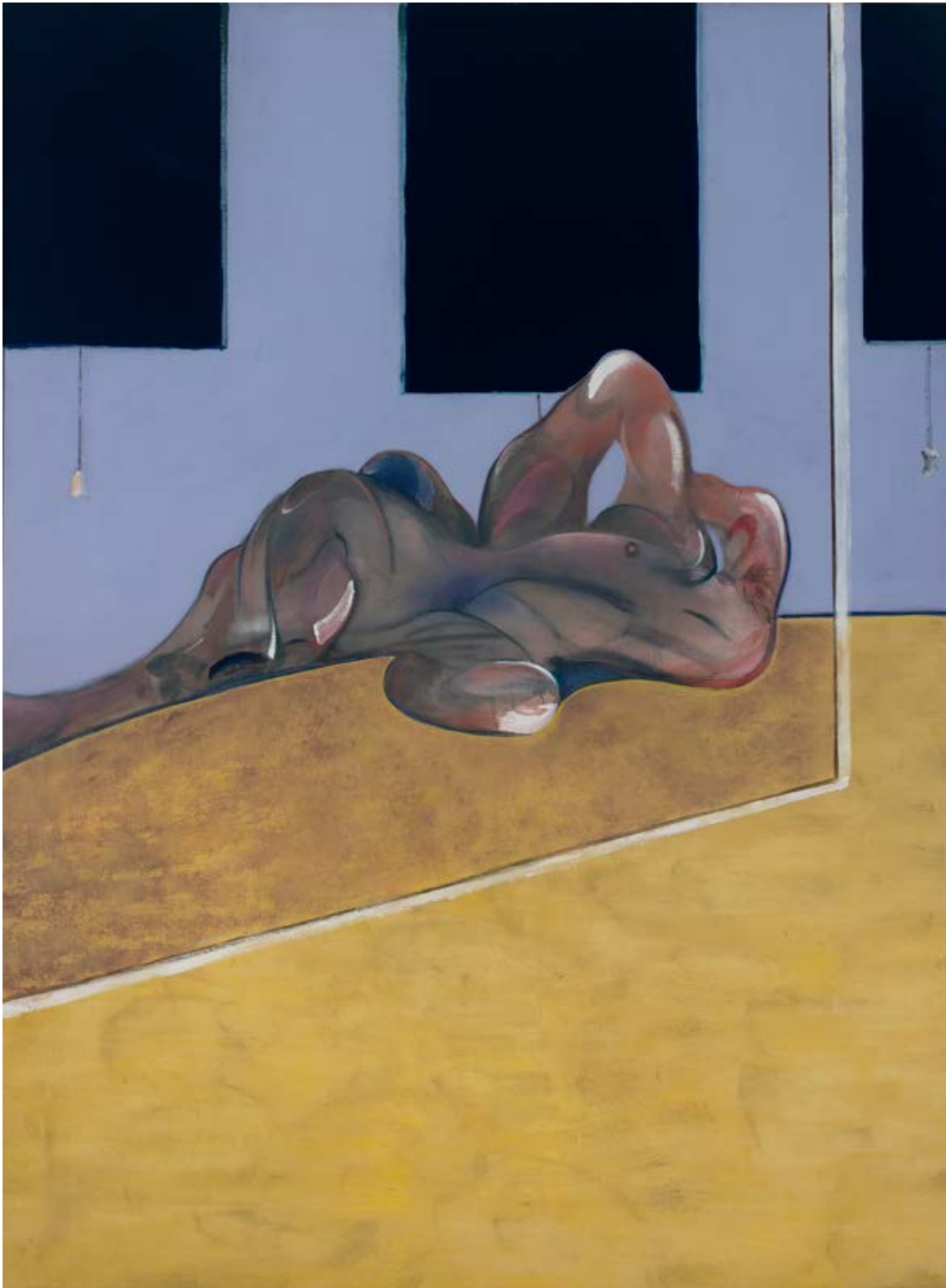
2. Francis Bacon (1909-1992) Lying Figure in Mirror (Figura tumbada en espejo) , 1971 Óleo sobre lienzo. 198,5 x 147,5 cm Museo Bellas Artes de Bilbao N.º inv. 82/215