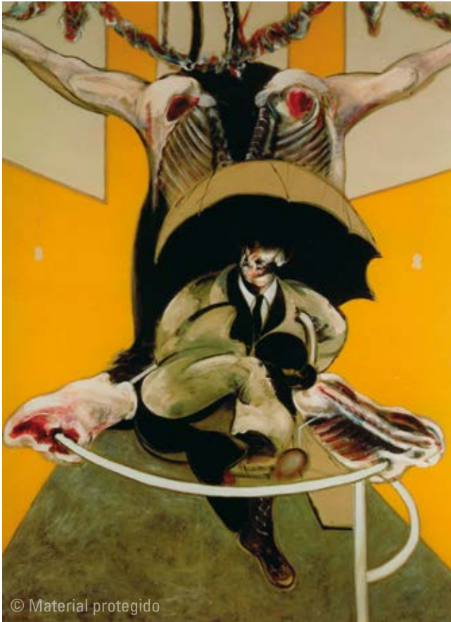
1. Francis Bacon (1909-1992) Pintura 1946 (Segunda versión) , 1971 Óleo sobre lienzo. 198 x 147,5 cm Museum Ludwig, Colonia

Bañado por una luz brillante, y sin embargo carente de sombra, el carnoso cuerpo parece una masa biomórfica en la que sólo se esbozan extremidades, la curvatura de las nalgas y una cabeza. De igual modo, a principios de la década de los treinta, Pablo Picasso había condensado el cuerpo humano en una superficie de color, y en un cuadro como Nu au jardin , de 1934 [fig. 3], había marcado mediante unas pocas líneas y algún breve signo, no sólo los contornos del voluminoso cuerpo, sino también los pechos, el ano y el pubis. Precisamente, la asombrosa fuerza de las obras de Picasso, que Bacon vio por primera vez en los años veinte en París, había impresionado tan fuertemente al joven irlandés que comenzó a dedicarse a la pintura. Es muy posible que Bacon conociese también el cuadro de gran formato de las fuertes y voluminosas Figures au bord de la mer (1931, fig. 4), al menos a través de una reproducción. La posición de las figuras colocadas sobre un realce arqueado y, sobre todo, la interpretación totalmente liberada de la fisonomía, así como de todas las convenciones relativas a la representación del cuerpo humano, avalan esta suposición.