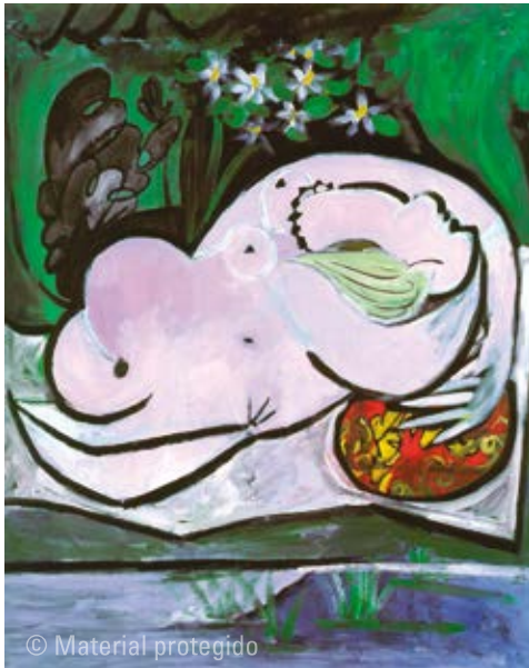
3. Pablo Picasso (1881-1973) Nu au jardin (Desnudo en el jardín) , 1934 Óleo sobre lienzo. 162 x 130 cm Musée Picasso, París