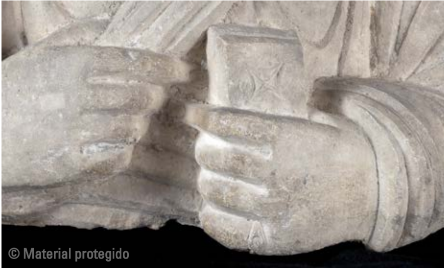
6. Estela funeraria de Palmira Museo de Bellas Artes de Bilbao N.º inv. 12/92 Detalles de las manos

que la zona inferior del torso está muy adelgazada frente al amplio volumen de la cabeza, que se representa casi completa y sobresale de forma notable, por lo puede deducirse que la pieza estaba destinada a ocupar un nicho elevado en la pared del hipogeo en que se situó originalmente y se procuró acentuar la proyección hacia delante de su rostro, para una mejor visibilidad desde el plano inferior.