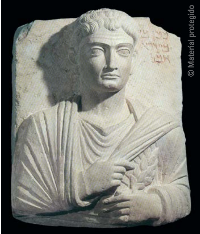
8. Estela funeraria de Palmira , primera mitad del siglo II Piedra En la actualidad, destruida. Anteriormente en el Museo Nacional de Palmira, Siria