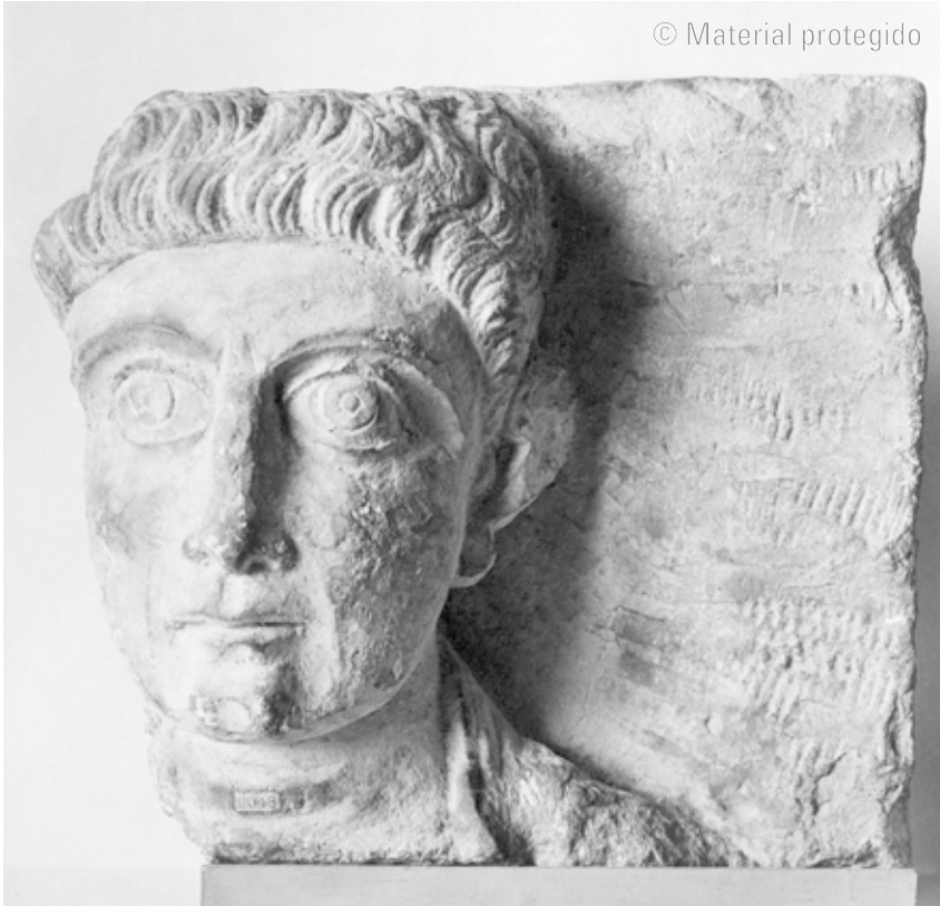
7. Cabeza de varón de un retrato funerario de Palmira, segunda mitad del siglo I-primer mitad del siglo II Piedra. 26,8 x 24,3 cm The Metropolitan Museum of Art, Nueva York N.º inv. 01.25.7

cinco en cinco con una evidente monotonía. La banda más estrecha de rizos se prolonga en unas pequeñas patillas que no sobrepasan la mitad de la altura de las orejas. Estos recursos son habituales en los retratos palmirenos y no restan expresividad al resultado final, en el que siempre se produce una sensación de vitalidad y de correspondencia activa con la mirada del personaje.