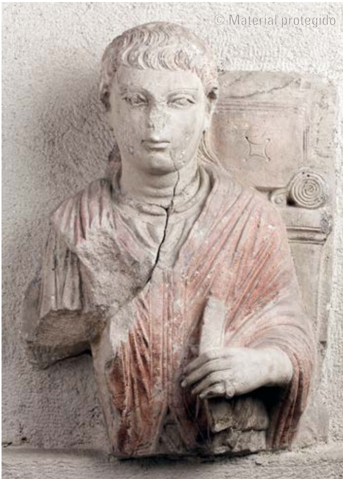
9. Estela funeraria de Palmira , c. 150 Piedra caliza. 51 cm (altura) The İstanbul Archaeological Museums N.º inv. 3793