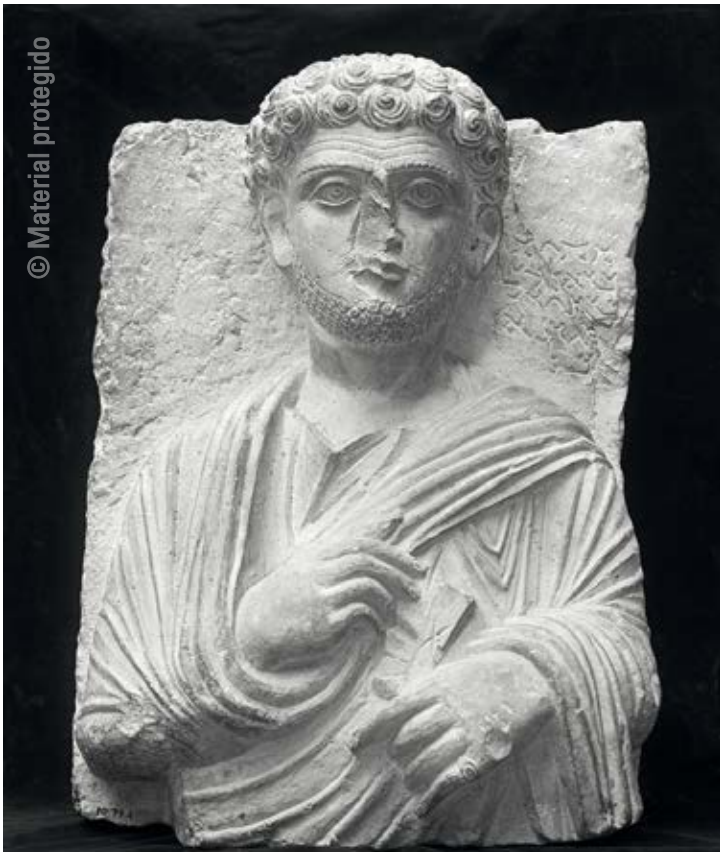
11. Retrato funerario de Mokimu , segunda mitad del siglo II Piedra. 58,5 x 42 cm Museum of Fine Arts, Boston. Donación del Estate Dona Estes N.º inv. 10.79a-b